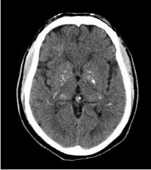
Figura 2: Calcificações localizadas simetricamente nos núcleos da base.